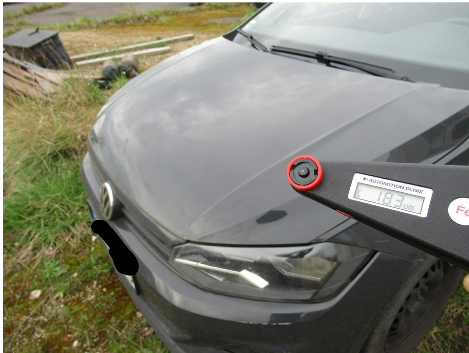
Bild 14 : Motordeckel mit erhöhter Lackschichtstärke (Nachlackiert)