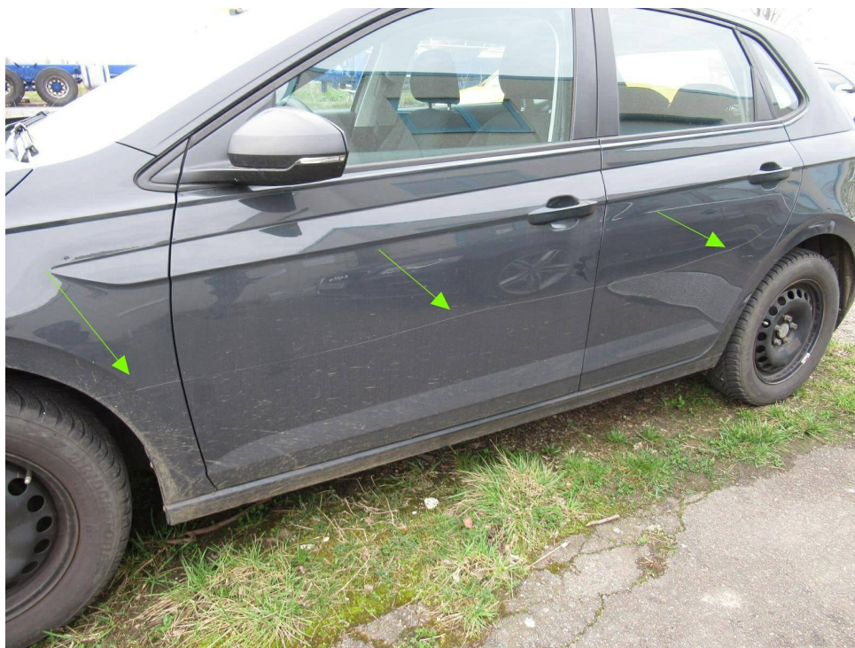
Bild 11 : Linke Fahrzeugseite von Kotflügel über Tür vorne links und Hinten links zerkratzt