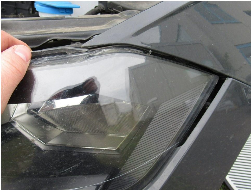
Bild 10 : Hauptscheinwerfer vorne links ist lose/Halterungen gebrochen