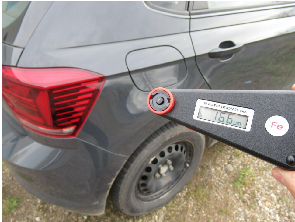
Bild 15 : Seitenwand rechts mit erhöhter Lackschichtstärke (Nachlackiert)